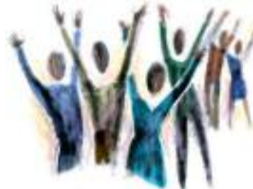
Praise the Lord

Jezus heeft door zijn offer de deur opengezet naar het eeuwig leven. Maar het is de Geest die de u kracht geeft, om dat offer te aanvaarden en de redding in u te bewerken. Vandaar dat er vanuit de Bijbel een ernstige waarschuwing klinkt aangaande de Heilige Geest: Daarom zeg Ik u: Alle zonde en lastering zal de mensen vergeven worden, maar de lastering van de Geest zal niet vergeven worden. (Mattheüs 12:31) ... maar wie gelasterd heeft tegen de Heilige Geest, heeft geen vergeving in eeuwigheid, maar staat schuldig aan eeuwige zonde. (Markus 3:29)